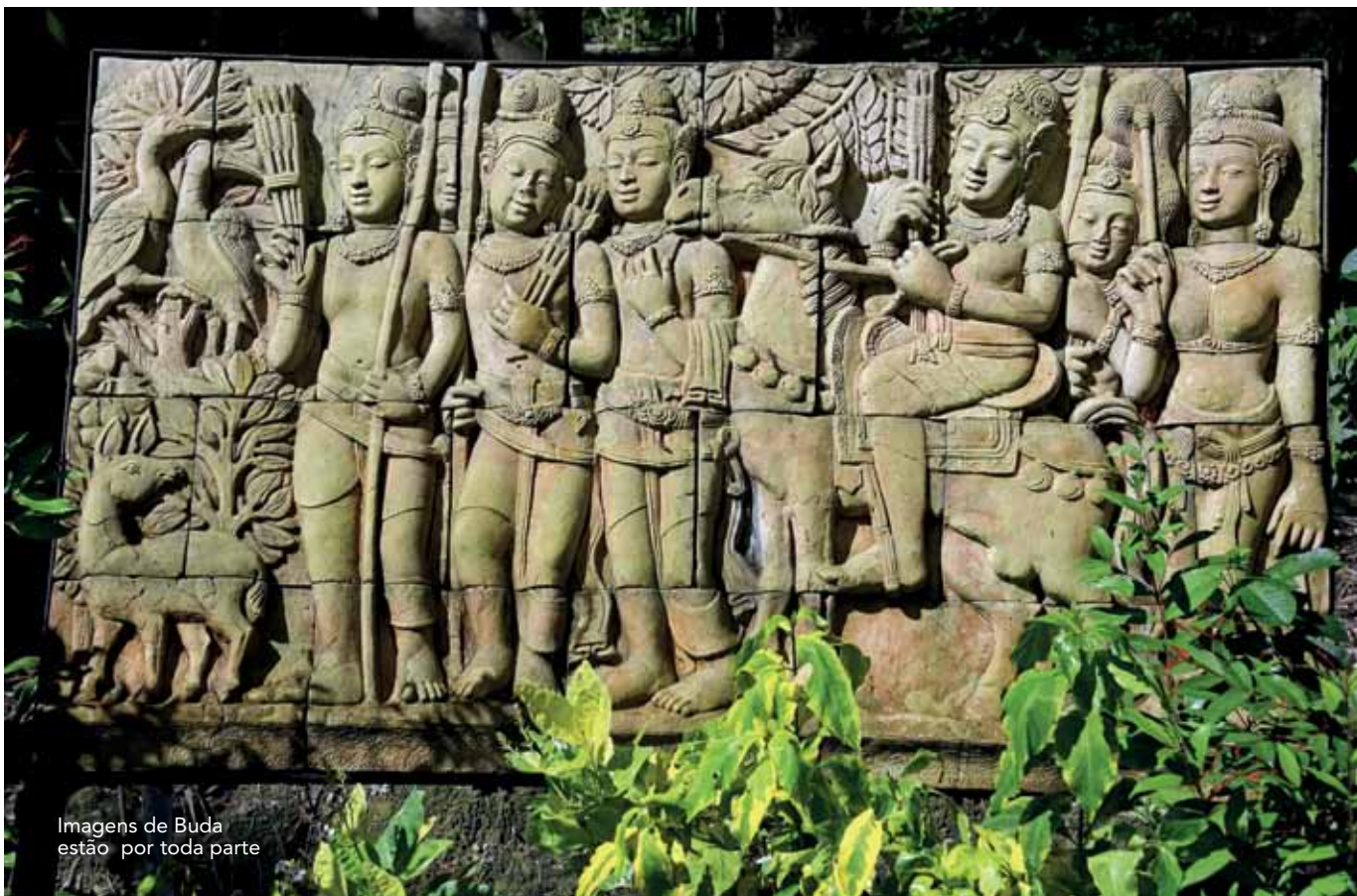
Imagens de Buda estão por toda parte