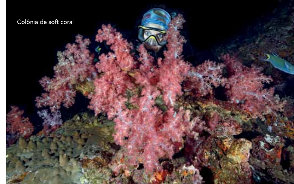
Colônia de soft coral