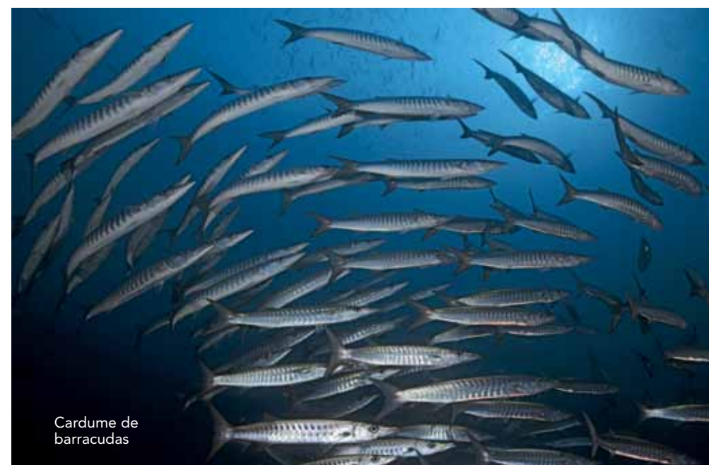
Cardume de barracudas