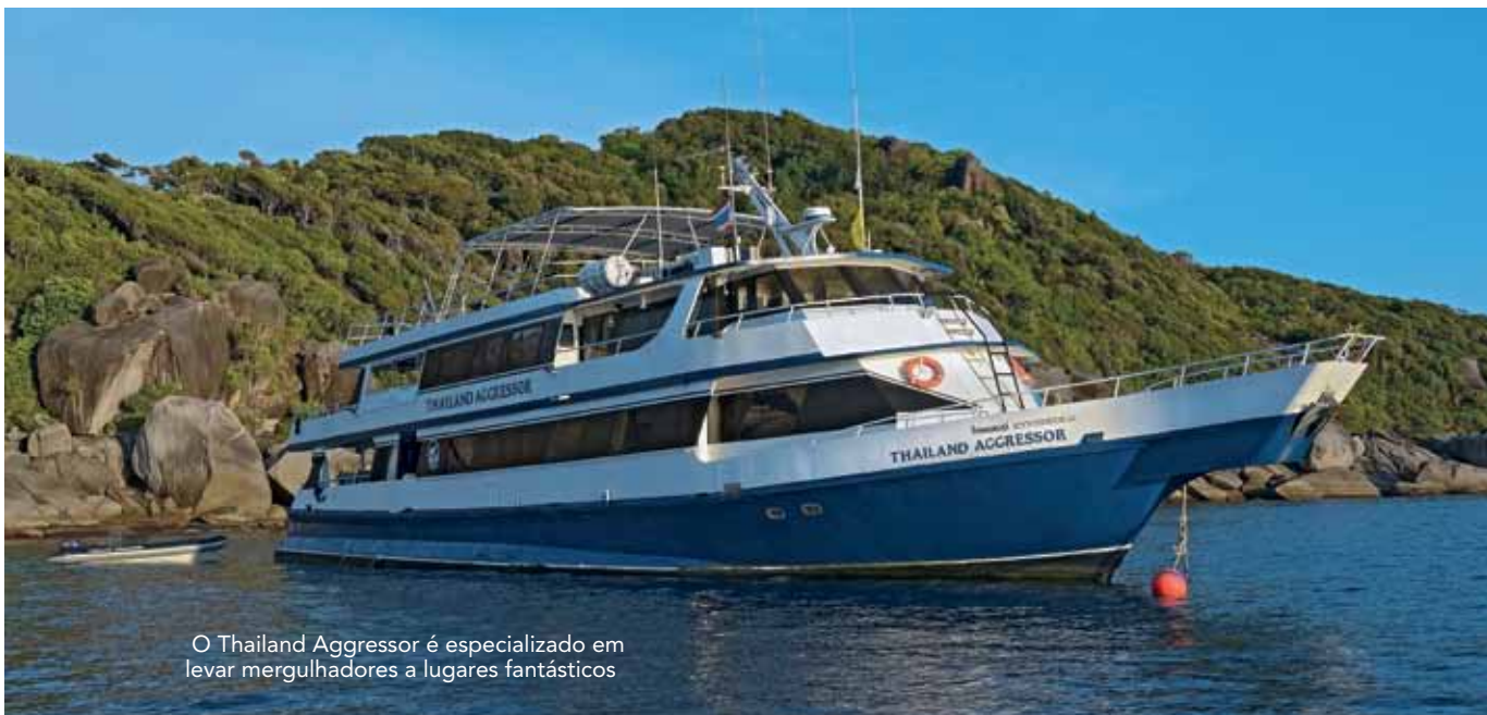
O Thailand Aggressor é especializado em levar mergulhadores a lugares fantásticos

de peixes-cardeais chocam seus ovos na boca. Quando se acasalam, a fêmea libera um pacote de ovos, que o macho fertiliza, esconde em sua boca e o incubam de sete a nove dias até que eclodam. Para fotografá-lo esperei pacientemente que o macho arejasse seus ovos, o que ele faz cuspidos-os para fora, para logo em seguida sugá-los novamente. Consegui clicá-lo no exato momento em que os ovos ficaram expostos.