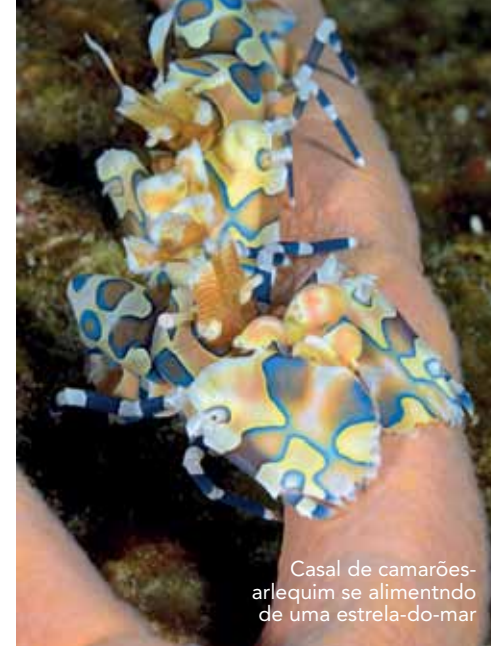
Casal de camarões-arlequim se alimentando de uma estrela-do-mar