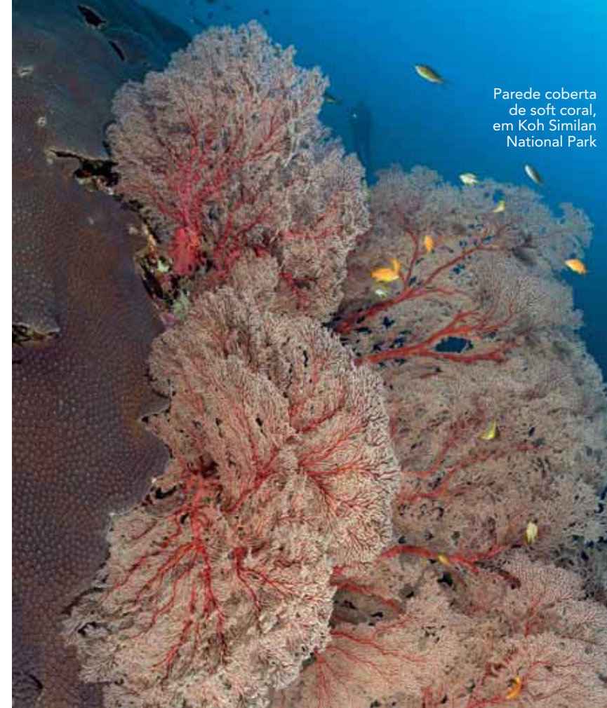
Parede coberta de soft coral, em Koh Similan National Park

Nosso grupo gostou tanto do primeiro dia de mergulho em Richelieu que unanimemente decidiu permanecer neste local por mais um dia. A biodiversidade é impressionante. Cardumes enormes de olhetes e corcorocas nadavam de uma forma tão sincronizada que pareciam estar dançando uma sinfonia inaudível. Grandes garoupas e inúmeros peixes tropicais vagam ao redor de árvores de