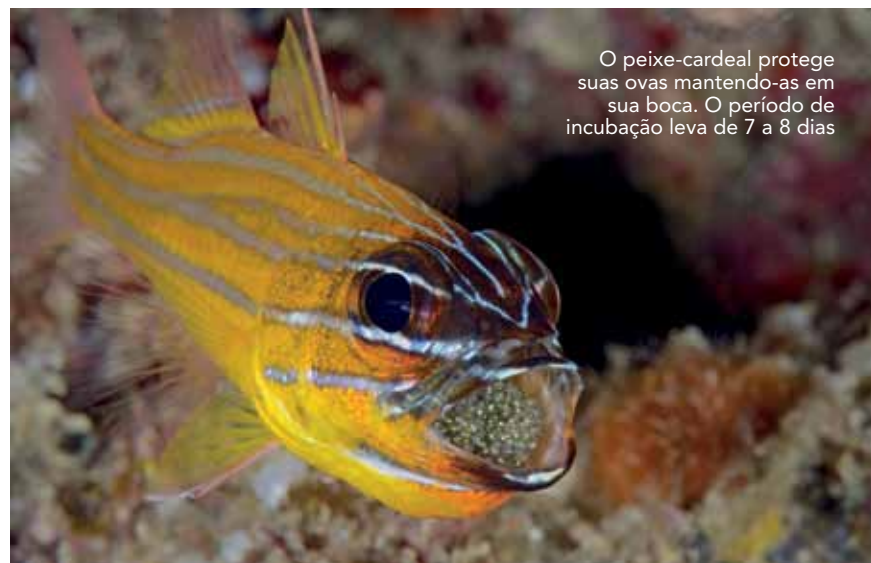
O peixe-cardeal protege suas ovas mantendo-as em sua boca. O período de incubação leva de 7 a 8 dias