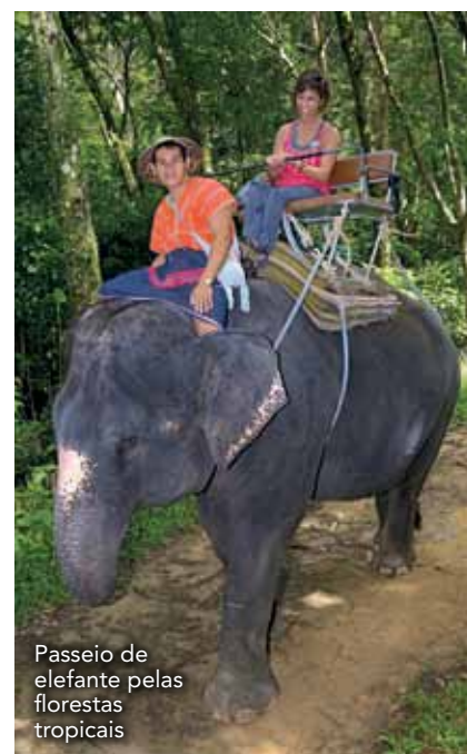
Passeio de elefante pelas florestas tropicais