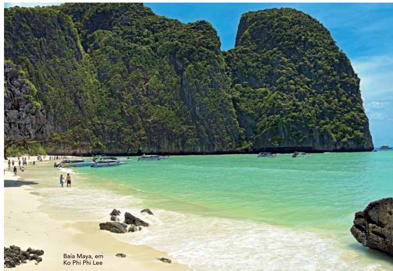
Baía Maya, em Ko Phi Phi Lee

por dia, diretamente do Thailand Aggressor ou de um barco de apoio. Você pode mergulhar com um duplo ou com um guia experiente. Uma atenção especial é dada aos fotógrafos e cinegrafistas garantindo que suas câmeras sejam lavadas e colocadas com segurança nas mesas especialmente alocadas para estes equipamentos depois de cada mergulho.