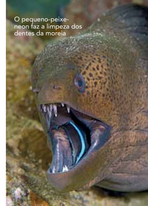
O pequeno-peixe-neon faz a limpeza dos dentes da moreia

Durante os mergulhos em Hin Daeng vimos um peixe-borboleta e um budião beliscando uma água-viva que foi empurrada contra o recife pela correnteza. Mais ao fundo, um polvo está empoleirado em cima de um coral olhando fixo para os mergulhadores. Um lampejo de meu