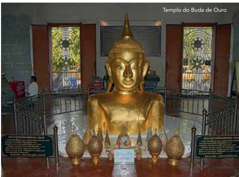
Templo do Buda de Ouro