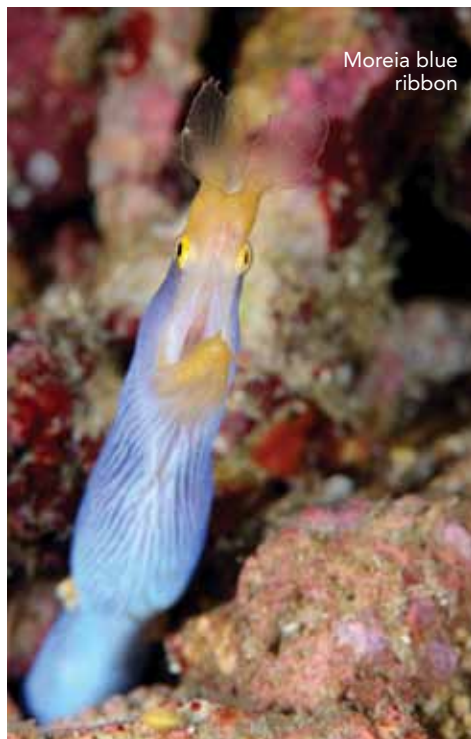
Moreia blue ribbon